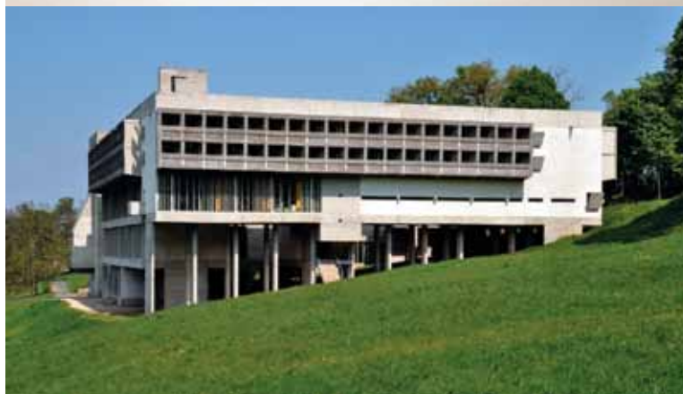
↑ La Tourette domonkos kolostora Père Couturier és Le Corbusier barátságának köszönhetően épült meg 1953 és 1959 között.