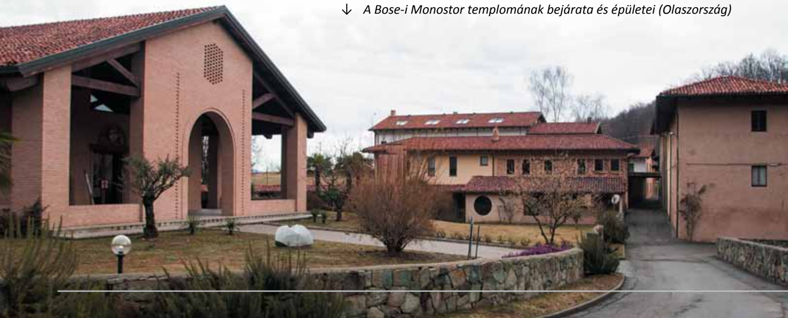
↓ A Bose-i Monostor templomának bejárata és épületei (Olaszország)

Másik példaként egy klasszikus, monasztikus életet élő közösséget hozunk ide: az olaszországi Bose-i Monostort , amely Enzo Bianchi nevével kapcsolódik össze. Ez a közösség teljesen hagyományosnak tekinthető monasztikus életet él, melyet az imádság és a munka helyes ritmusának megtalálása jellemez. Fontos tényező az alapítás ökumenikus nyitottsága, a szerzetesség történetének és kortárs szerepének tanulmányozása és a monostor vendégfogadó, feltöltődést kínáló „oázis” jellege. A közösség fontos tapasztalatokat hordoz arról, hogy egy abszolút tradicionálisnak (és sokak szerint idejét múltnak) számító szigorú monasztikus életet miként lehet a mai világban, a ma emberének érthetővé és adott esetben élhetővé tenni.