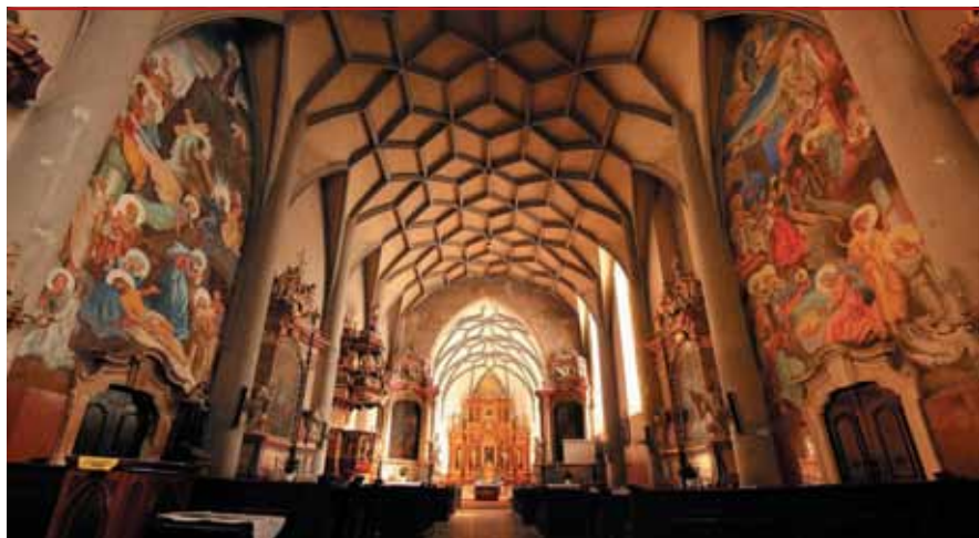
↑ Szeged–Alsóvárosi Havas Boldogasszony templom (ferences fenntartású) A szentély csillagboltozattal, a templomhajó pedig hálóboltozattal fedett. Jelentős különbség a kettő között, hogy a csillagboltozatnál először a bordákat építik meg, majd ezekre, mint vezérgörbékre, szabadkézből falazott, kétszer görbült boltsüvegeket emelnek, míg a hálóboltozatnál először egy egyszer görbült felületű dongaboltozatot építenek, amelyet aztán alulról, hálós bordarácscsal díszítenek.

(befejező rész a 2015. augusztusi számban)